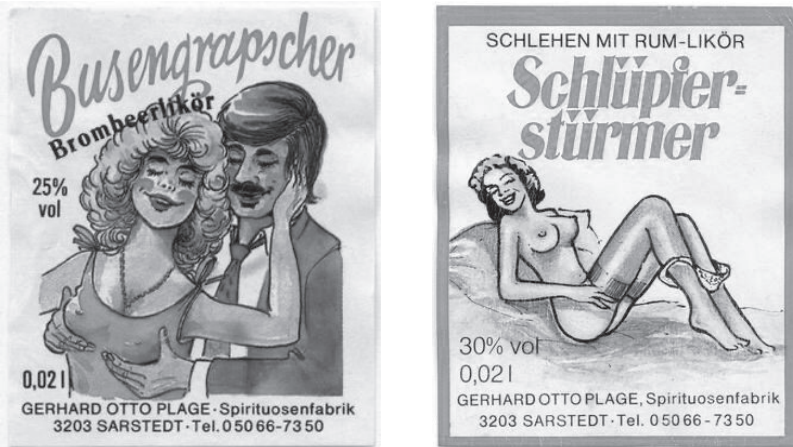
Abb. 12: „Busengrabscher“ und „Schlüpfierstürmer“, Deutschland, 1990

Die Vorinstanzen (Landgericht Berlin und das Kammergericht) 774 hatten die Flaschenetiketten als einen „Scherz mit sexuellen Phantasievorstellungen“, der zwar „geschmacklos“, aber für Werbekampagnen üblich sei, bewertet. 775 Ergänzend meint das Kammergericht, dass „[f]ür die moderne Werbung [...] kennzeichnend ist, daß sie durch drastische Schlagworte, frivole Texte und sexbetonte Bilder die Aufmerksamkeit des Publikums zu erwecken sucht“. 776 Aufgrund der Gewöhnung des Publikums an eben solche Werbebilder, könne nach der Bewertung des Gerichts bei den Abbildungen nicht von einer Verletzung des sittlichen Empfindens der adressierten Verkehrskreise gesprochen werden. 777