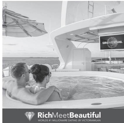
Abb. 27: RichMeetBeautiful, 2019

2018 gingen neun Beschwerden und 2019 zwölf Beschwerden zu geschlechterdiskriminierender Werbung ein, von denen keine von der Forbrukertilsynet als problematisch bewertet wurde. Allein eine Werbeanzeige bei der die Forbrukertilsynet eigeninitiativ tätig geworden war, wurde als Verstoß gegen § 2 Abs. 2 MFL gewertet. 1095