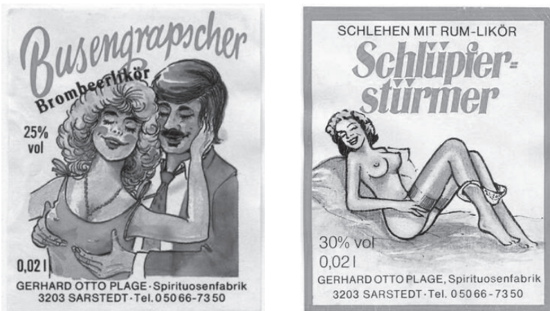
Abb. 12: „Busengrabscher“ und „Schlüpfierstürmer“, Deutschland, 1990

Die Vorinstanzen (Landgericht Berlin und das Kammergericht) 774 hatten die Flaschenetiketten als einen „Scherz mit sexuellen Phantasievorstellungen“, der zwar „geschmacklos“, aber für Werbekampagnen üblich sei, bewertet. 775 Ergänzend meint das Kammergericht, dass „[f]ür die moderne Werbung [...] kennzeichnend ist, daß sie durch drastische Schlagworte, frivole Texte und sexbetonte Bilder die Aufmerksamkeit des Publikums zu erwecken sucht“. 776 Aufgrund der Gewöhnung des Publikums an eben solche Werbebilder, könne nach der Bewertung des Gerichts bei den Abbildungen nicht von einer Verletzung des sittlichen Empfindens der adressierten Verkehrskreise gesprochen werden. 777