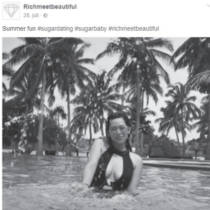
Abb. 26: RichMeetBeautiful, 2017