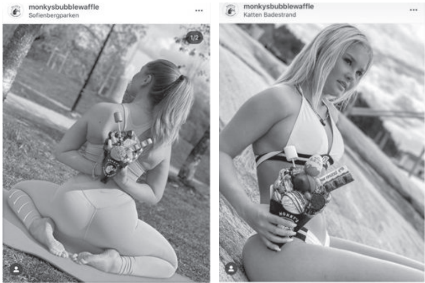
Abb. 28: Bubble Wrap AS/Monkys Bubble Waffle, 2020

2020 gingen 36 Beschwerden ein, von denen 28 auf eine einzige Werbekampagne für Eiswaffeln der Firma Bubble Wrap AS/Monkys Bubble Waffle fielen. 1096 In dieser wurden leicht bekleidete Mitarbeiterinnen des Unternehmens in sexuellen Posen abgebildet (Abb. 28), wobei zum einen die mangelnde Produktrelevanz, zum anderen der Fokus auf den Körper der Frauen kritisiert wurde. Neben der erheblichen Kritik durch die Forbrukertilsynet erhielt der Fall viel Medienaufmerksamkeit. Infolgedessen wurden die Marketing-Posts auf dem Instagram-Konto des Unternehmens entfernt und der General Manager von Monkys Bubble Waffle entschied sich, das Unternehmen zu verlassen. 1097