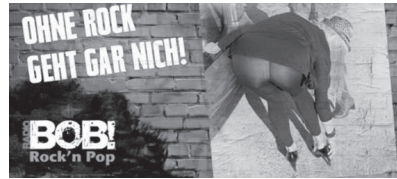
Abb. 20: Radio Bob, Deutschland, 2015

Teilweise wird kritisiert, dass die Entscheidungspraxis des Werberats nicht transparent genug sei. So wäre keine „erkennbare Stringenz“ bei der Beurteilung der Werbungen auszumachen. 942 Der Verein Pinkstinks verdeutlicht dies bei der Gegenüberstellung der Werbekampagnen zweier Radiosender. Beide nutzen einen Frauenkörper bzw. weibliche Körperteile als Blickfang. In beiden Anzeigen gab es keinen relevanten Produktbezug. Die erste, die mit einem nur mit Büstenhalter bekleideten Oberkörper einer Frau warb, erhielt eine Rüge (Abb. 19). 943 Die zweite, deren Werbebild das Hinterteil einer sich bückenden Frau zeigte, wurde demgegenüber als zulässig bewertet (Abb. 20). Gleiches Produkt, gleicher Werbestil und doch ein anderes Urteil. 944