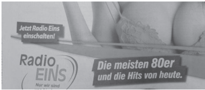
Abb. 19: Radio EINS, Deutschland, 2015

torms durchaus auf die Regulierung von Werbeinhalten einwirken sowie die Grenzen des Zulässigen mitprägen.