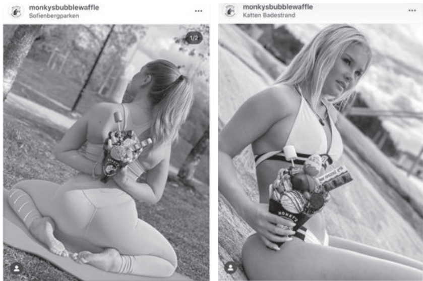
Abb. 28: Bubble Wrap AS/Monkys Bubble Waffle, 2020

2020 gingen 36 Beschwerden ein, von denen 28 auf eine einzige Werbekampagne für Eiswaffeln der Firma Bubble Wrap AS/Monkys Bubble Waffle fielen. 1096 In dieser wurden leicht bekleidete Mitarbeiterinnen des Unternehmens in sexuellen Posen abgebildet (Abb. 28), wobei zum einen die mangelnde Produktrelevanz, zum anderen der Fokus auf den Körper der Frauen kritisiert wurde. Neben der erheblichen Kritik durch die Forbrukertilsynet erhielt der Fall viel Medienaufmerksamkeit. Infolgedessen wurden die Marketing-Posts auf dem Instagram-Konto des Unternehmens entfernt und der General Manager von Monkys Bubble Waffle entschied sich, das Unternehmen zu verlassen. 1097