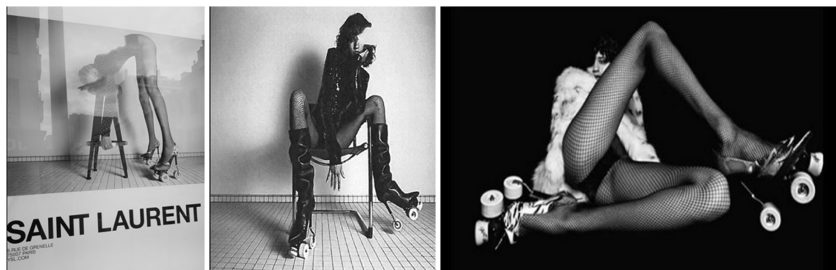
Abb. 25: Yves Saint Laurent Werbung, 2017

unter den Schuhen abbildete (Abb. 25), kam die JDP zu dem Schluss, dass die Werbebilder die Frauen in sexuellen, leicht unterwürfigen Posen zeigen würden, die die Frauen zum Sexualobjekt degradieren und die Unterlegenheit der Frau in der Gesellschaft suggerieren würde. 1039