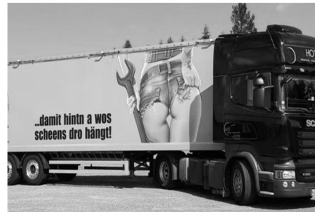
Abb. 23: LKW der Spedition Hotz, 2021