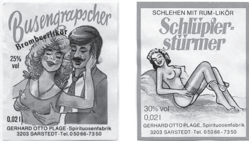
Abb. 12: „Busengrabscher“ und „Schlüpfierstürmer“, Deutschland, 1990

Die Vorinstanzen (Landgericht Berlin und das Kammergericht) 774 hatten die Flaschenetiketten als einen „Scherz mit sexuellen Phantasievorstellungen“, der zwar „geschmacklos“, aber für Werbekampagnen üblich sei, bewertet. 775 Ergänzend meint das Kammergericht, dass „[f]ür die moderne Werbung [...] kennzeichnend ist, daß sie durch drastische Schlagworte, frivole Texte und sexbetonte Bilder die Aufmerksamkeit des Publikums zu erwecken sucht“. 776 Aufgrund der Gewöhnung des Publikums an eben solche Werbebilder, könne nach der Bewertung des Gerichts bei den Abbildungen nicht von einer Verletzung des sittlichen Empfindens der adressierten Verkehrskreise gesprochen werden. 777