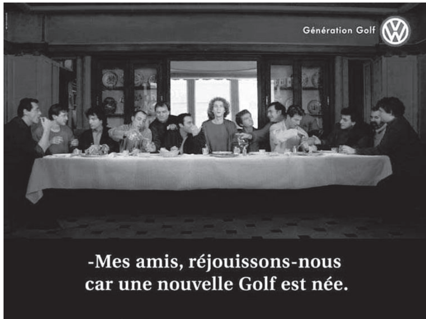
Abb. 8: Volkswagen, Frankreich, 1998

Lingenfelder spricht diesbezüglich von einem „Vorhandensein [...] interkultureller Divergenzen“ und einem „positiven [sowie] negativen Herkunftsländereffekt“. 654 Danach müssten Werbetreibende sich der unterschiedlichen Bedeutungen etwa von „Zeichen, Farben, Symbolen und Wörtern“ bewusst sein und ihre Werbebotschaften gegebenenfalls national anpassen. Insbesondere Werbung mit Humor und Aussagen, die an das traditionelle Rollenverständnis von Männern und Frauen anknüpfen würden, würden in den verschiedenen Ländern Europas unterschiedlich bewertet werden. 655