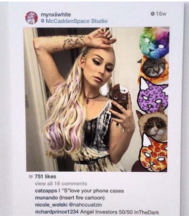
Abb. 7.2.: Richard Prince, Print der Reihe „New Portraits“, 2014.

Die Klage von Eric McNatt vom 16.11.2016 gegen die Nutzung seiner Fotografie in der Reihe „New Portraits“ von Prince ist weiterhin anhängig und wurde noch nicht entschieden. 190