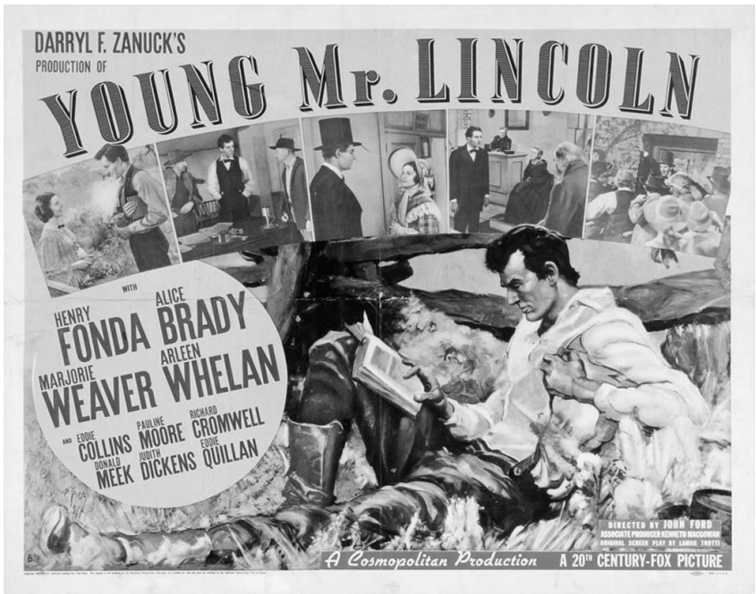
Abbildung 1: Historisches, im Original vierfarbiges, Werbematerial für den Film „Young Mr. Lincoln“ (USA 1939). Man sieht den späteren US-Präsidenten u.a. auf dem Zentralbild als strammen Jüngling beim Studium des Common Law, beim Schlichten eines Nachbarschaftstreits im zweiten kleinen Bild von links, und schließlich als Anwalt vor Gericht und wie er ganz allein einen Lynchmob aufhält auf dem Bilderreigen rechts. http://www.ciomuse.com/young-mr-lincoln-1939.html , zuletzt aufgerufen am 28. 02. 2017.

deutschen Fernsehrichterinnen und -richter mehr demonstrative Fairness für die Betroffenen, die vor der Richterbank auftraten. 28