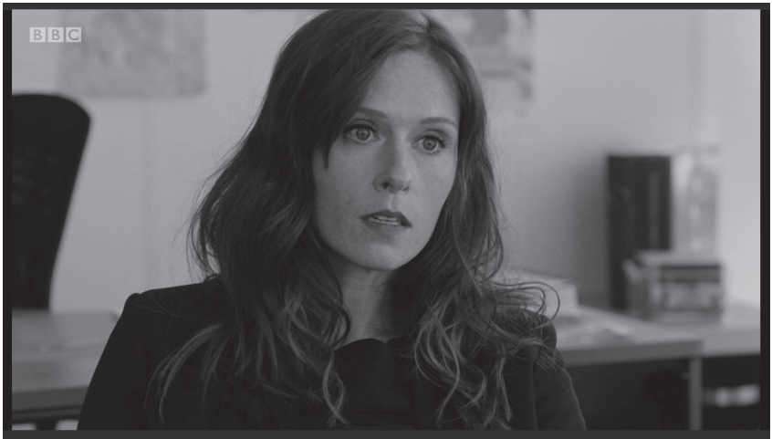
Abbildung 2: Anwältin Joséphine Karlsson (gespielt von Audrey Fleurot) beginnt ein Doppelspiel im Dienst von und gegen organisierte Kriminelle. In dieser Szene hat sie einen korrupten Unternehmer dazu gebracht, den Übergriff der zwei Hauptpersonen der Serie auf ihren Mandanten anzuzeigen. Filmstill von „Engrenages“, Serie 7, Folge 9 (Frankreich 2019). Screenshot des Autors vom BBC i-player, 4. 12. 2019.