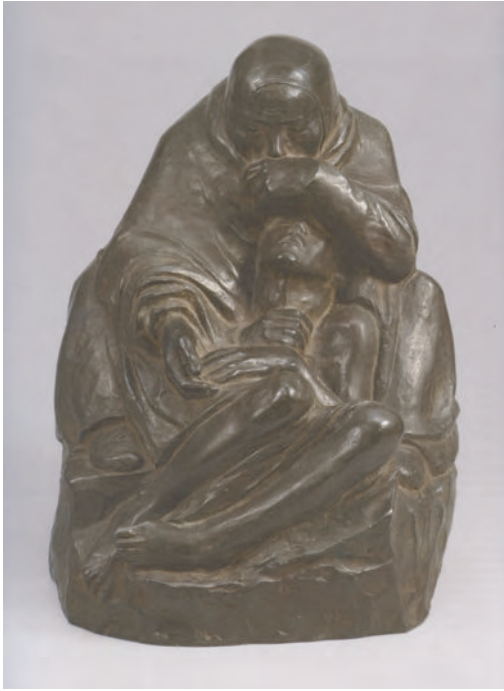
Abb. 2: Käthe Kollwitz, Pietà (auch: Mutter mit totem Sohn ), Entwurf: 1937–1939, Guss: 1939/1940, Zink, Höhe 38,6 x Breite 28,8 x Tiefe 40,3 cm, Kölner Kollwitz Sammlung

drücklich dagegen ausgesprochen habe. 19 Das mag sein, doch die Veränderung der Größe stellt aus kritisch kunsthistorischer Sicht einen unzulässigen Eingriff in die konzeptionellen Vorgaben dar. Bei der „Pietà“ von Käthe Kollwitz lag für die vierfache Vergrößerung eine Autorisierung durch die Erbgemeinschaft vor, und doch kann man die Plastik in der Neuen Wache nicht mit dem Begriff des Originals nobilitieren, worauf auch die demonstrative Nichtaufnahme in das offizielle, von Annette Seeler verfasste Werkverzeichnis der Künstlerin hinweist. 20 Die starke Vergrößerung bedeutet eine Monumentalisierung der eigentlich intimen, nur 38