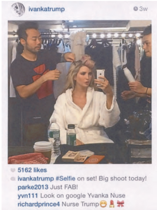
Abb. 6: Richard Prince, Untitled (portrait) , Tintenstrahlruck auf Leinwand, 167,0 x 123,8 cm, Sammlung Ivanka Trump, New York

behaupten, dass ein erworbenes Bild eine Fälschung sei, nur weil ihm aus politischen Gründen die Käuferin nicht genehm ist. Deshalb bezeichnet der Kunstkritiker Jonathan Jones die ganze Aktion als „Witz“ und „post-modernen Spaß“. 41 Für Prince war sie jedoch durchaus eine sehr ernste, weil eben politische Angelegenheit, auch wenn sein Protest nur eine symbolische und keine kunstrechtliche Bedeutung haben kann. Letztendlich lässt sich in diesem außergewöhnlichen Vorgehen von Richard Prince auch ein Versuch zur Beantwortung der schwierigen Frage sehen, wie heutige Künstler und Künstlerinnen auf Donald Trump und seine Familie angemessen und wirksam reagieren können, wie sich also Kritik und Protest in künstlerischer Form effektiv vermitteln lassen. Prince jedenfalls hat mit seiner Behauptung einer Fälschung und den nachfolgenden Erklärun-