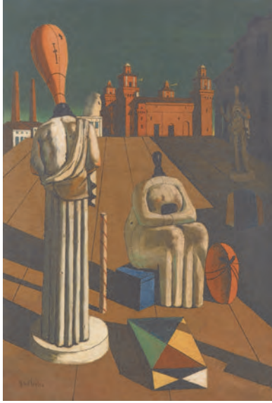
Abb. 3: Giorgio de Chirico, Die beunruhigenden Musen , 1918, Öl auf Leinwand, 97,0 x 66,0 cm, Privatsammlung

den Produktionsprinzip erhob und die jene Werke jeder authentischen Zeitlichkeit enthob, ging er in seinem römischen Atelier bis in die 1970er-Jahre nach. Von dem besonders bekannten Gemälde „Le muse inquietanti“ von 1918 (Abb. 3) malte er etwa 65 Kopien, und von dem Gemälde „Il Trovatore“ von 1917 existieren sogar über 100 Exemplare.