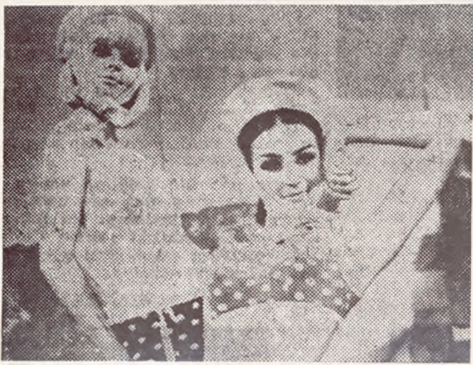
Abb. 4: Sigmar Polke, Freundinnen I , 1967, Offsetdruck auf Karton, 47,9 x 60,8 cm, Kupferstichkabinett Berlin