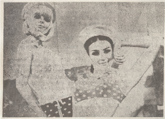
Abb. 5: Unbekannter Fälscher nach Sigmar Polke, Freundinnen I , 1999, Offsetdruck auf Karton, 47,9 x 60,8 cm, Privatsammlung