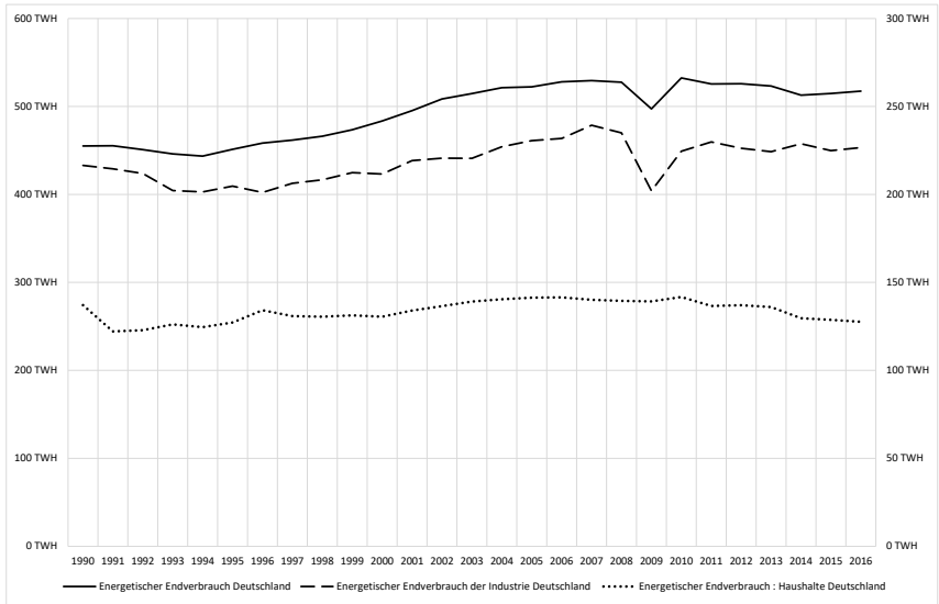
Abbildung 2: Stromverbrauch in Deutschland zwischen 1990 und 2016.