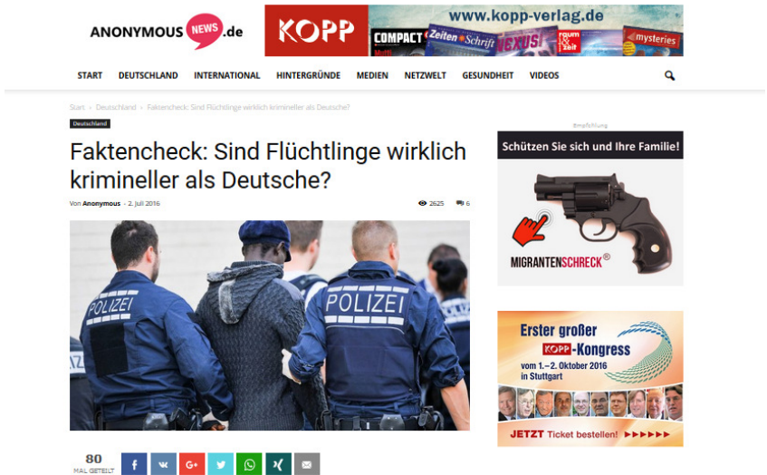
Abbildung 2.1: Werbung für Waffen und den Kopp-Verlag auf anonymous-news.ru

Waffenhandel nutzte (siehe Abb. 2.1). Dennoch zeigt der Fall: Im deutschsprachigen Internet ermöglichen Fake News perfide Geschäftsmodelle.