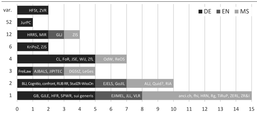
Abb. 2: Erscheinungsrhythmus der 46 rechtswissenschaftlichen Internetzeitschriften (linke Achse: Ausgaben pro Jahr, „var.“ = variabel), jeweils mit genutzten Beitragssprachen: nur Deutsch (DE), nur Englisch (EN) oder mehrsprachig (MS).

Archivs förderte nur Texte auf Deutsch, Englisch und romanische Sprachen zutage, während keine Beiträge auf Arabisch, Chinesisch oder Russisch zu finden waren. Nicht-lateinische Schriftsysteme nutzen nur zwei Zeitschriften: DGStZ („stets zweisprachig“ auf Deutsch und Georgisch) 60 und ReOS (Ukrainisch und Russisch neben Deutsch und Englisch). 61