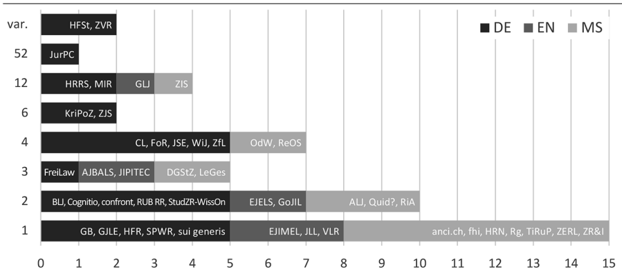
Abb. 2: Erscheinungsrhythmus der 46 rechtswissenschaftlichen Internetzeitschriften (linke Achse: Ausgaben pro Jahr, „var.“ = variabel), jeweils mit genutzten Beitragssprachen: nur Deutsch (DE), nur Englisch (EN) oder mehrsprachig (MS).

Archivus förderte nur Texte auf Deutsch, Englisch und romanische Sprachen zutage, während keine Beiträge auf Arabisch, Chinesisch oder Russisch zu finden waren. Nicht-lateinische Schriftsysteme nutzen nur zwei Zeitschriften: DGStZ („stets zweisprachig“ auf Deutsch und Georgisch) 60 und ReOS (Ukrainisch und Russisch neben Deutsch und Englisch). 61