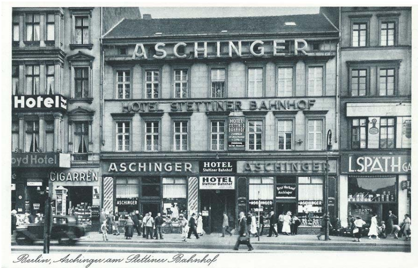
Abb. 18: Aschinger am Stettiner Bahnhof, Berlin ca. 1933