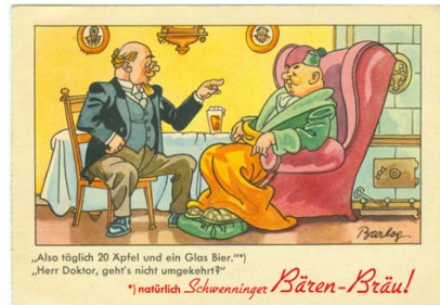
Abb. 25: Werbekarten von Bären-Bräu in Schwenningen – eine Serie, die spätestens seit 1938 Verwendung fand; links eine Karte als Feldpost vom November 1940, rechts privat verschickt im Juli 1944