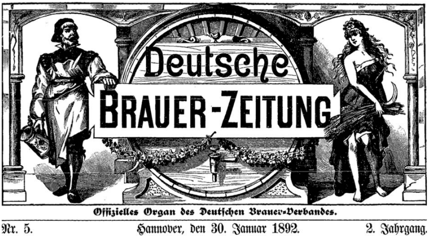
Abb. 28: Deutsche Brauerzeitung, Titelblatt vom 30.1.1892

Quelle: Deutsche Brauerzeitung, www.library.fes.de/gewerkschaftszeitschrift/ol/?id:38490 (Zugriff 6.6.2018)