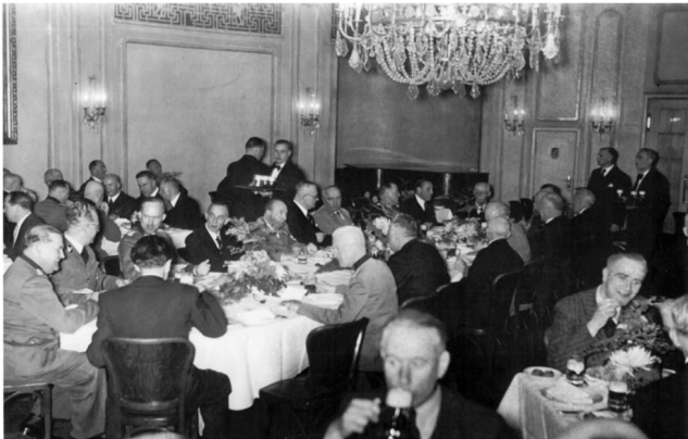
Abb. 16: Feier zum hundertjährigen Jubiläum der Schultheiss-Brauerei, Berlin, Deutsche Oper, 1943 (2)