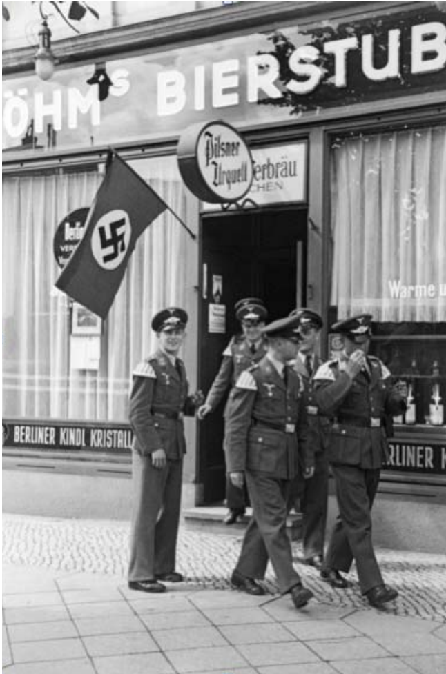
Abb. 20: Angehörige einer Musikkapelle der SA vor einer Bierstube, Berlin, 1937