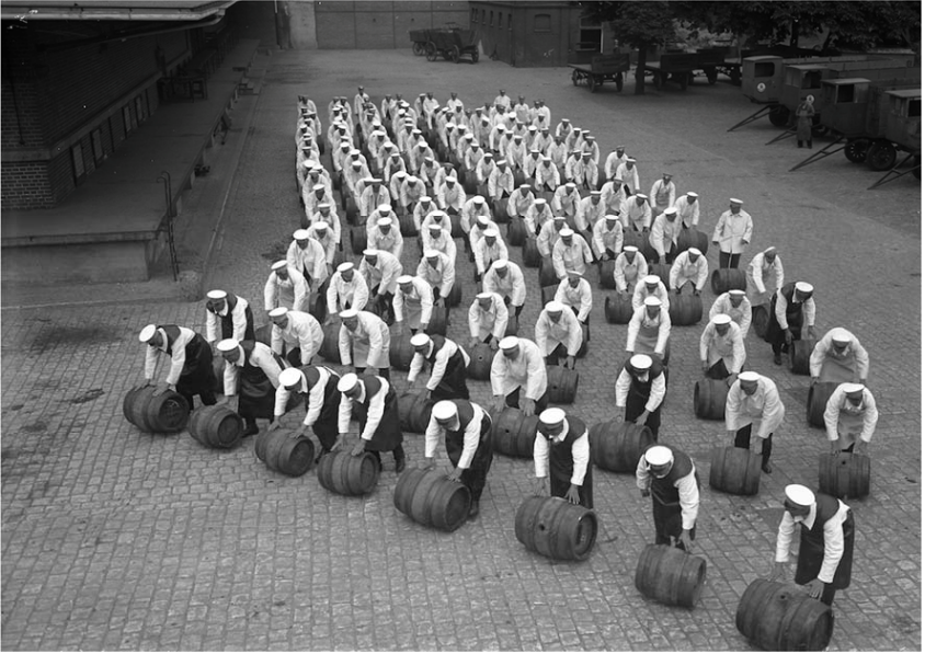
Abb. 14: Berlin hat Durst! Hochbetrieb in einer Berliner Brauerei während der heißen Tage. Die Bierbrauer beim Anrollen der Fässer mit dem kühlen Trunk, Juli 1934 (Originaltitel)