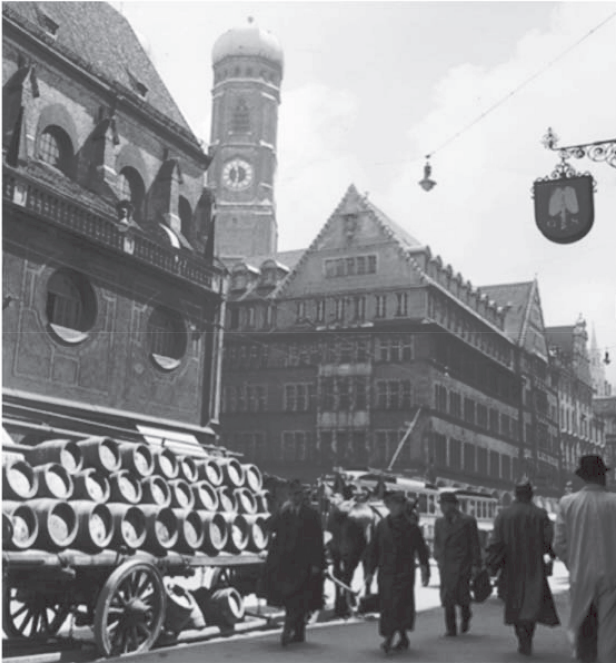
Abb. 26: Kaufingerstraße, München, 1940

Erzeugung und dem Vertrieb des Bieres“. Ab 1943 sollte die Werbung „kriegsdienend“ sein und einen „Beitrag zur Erhaltung und Stärkung des deutschen Siegeswillens“ darstellen, aber diese Vorgaben änderten wenig an den bisher üblichen Werbemitteln. Selbst wenn der Werbeaufwand insgesamt stark zurückging, verwendete etwa Bären-Bräu in Schwenningen auch in den Kriegsjahren Postkarten, die patriarchale Butzenscheiben-Idyllen früherer Zeiten wachrufen sollten. 61