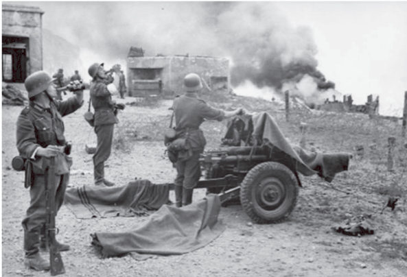
Abb. 23: Dieppe, an der französischen Atlantikküste – Infanteristen und Artilleristen, Sommer 1942