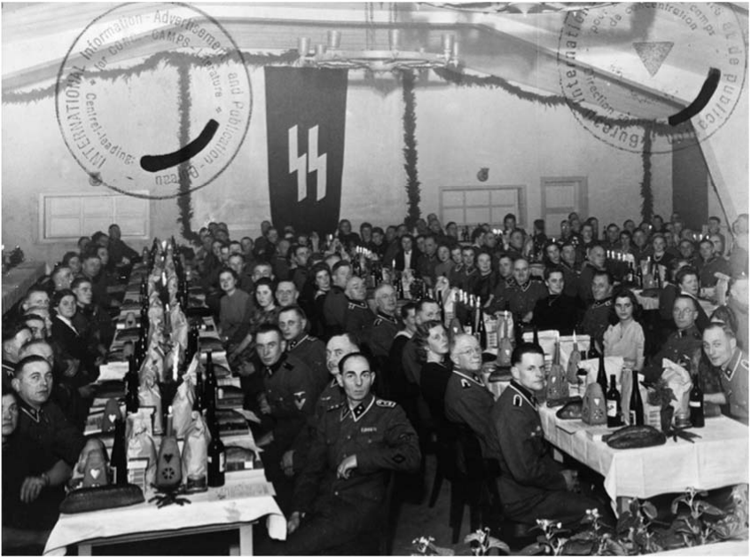
Abb. 24: Weihnachtsfeier der SS-Wachmannschaft im Konzentrationslager Neuengamme, 1943