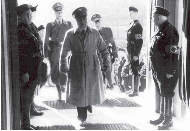
Abb. 15: Feier zum hundertjährigen Jubiläum der Schultheiss-Brauerei, Berlin, Deutsche Oper, 1943 (1)