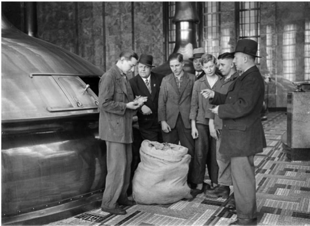
Abb. 29: Reichsberufswettkampf der deutschen Jugend. Vor der Hopfengabe in die Braupfanne wird die Güte des Hopfens besprochen, Berlin, 1936 (Originaltitel)

Die Zahl der Beschäftigten ging seit Mitte der 1920er Jahre, als mehr als 85.000 Arbeitskräfte im Braugewerbe tätig waren, stetig zurück. Dank der fortschreitenden Produktivität setzte sich dieser Trend trotz des steigenden Ausstoßes der Brauereien auch nach 1933 fort. Ab 1939 verminderte sich die Zahl der Beschäftigten noch stärker aufgrund der zahlreichen Einberufungen zur Wehrmacht. Zu einem kleinen Teil wurden die fehlenden Arbeitskräfte durch Frauen, ab 1941 außerdem durch Kriegsgefangene ersetzt. 72