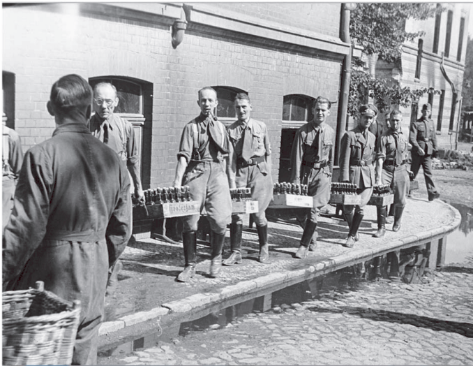
Abb. 17: Betreuung von Bombengeschädigten: SA beim Antransport von Bier und Getränken, Berlin, August 1943

Während die gesamten Einzelhandelsverkäufe pro Kopf im „Altreich“ bei einem Index von 1938=100 in den folgenden zwei Jahren erheblich zurückgingen, stieg die mengenmäßige Abgabe von Bier in diesem Zeitraum auf 116 an. Und selbst danach verlief der Rückgang beim Bier allmählicher als bei den Einzelhandelsverkäufen. Diese lagen 1943 bei einem Indexwert von 69, der Bierabsatz jedoch immer noch bei 96. 51