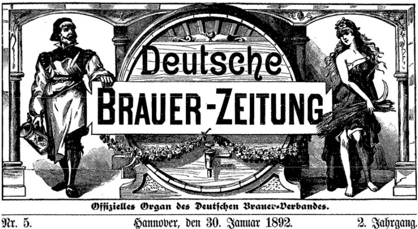
Abb. 28: Deutsche Brauerzeitung, Titelblatt vom 30.1.1892

Quelle: Deutsche Brauerzeitung, www.library.fes.de/gewerkschaftszeitschrift/ol/?id:38490 (Zugriff 6.6.2018)