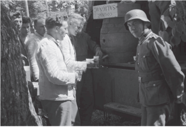
Abb. 22: Ostpreußen in Bereitschaft, Sommer 1941 (Originaltitel)

Quelle: Bundesarchiv-Bildarchiv, Nr. 963 Bild-14-25A, Fotograf Otto Kaiser