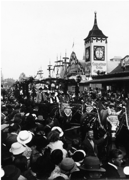
Abb. 12: Theresienwiese, München, Oktober 1935 (1)

Das Oktoberfest 1935 und das Bier in den Vorkriegsjahren