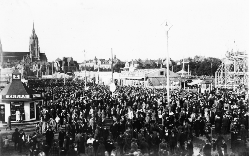
Abb. 13 : Theresienwiese, München, Oktober 1935 (2)