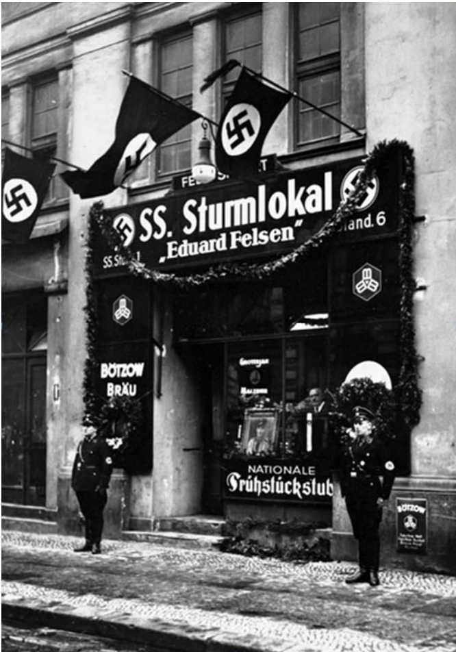
Abb. 19: SS-Sturmlokal in der Alten Jakobstraße, Berlin, 1934