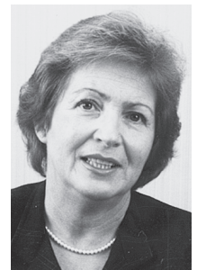
Vorsitzende der Kommission Ältere Menschen des djb, Rechtsanwältin, St. Wendel