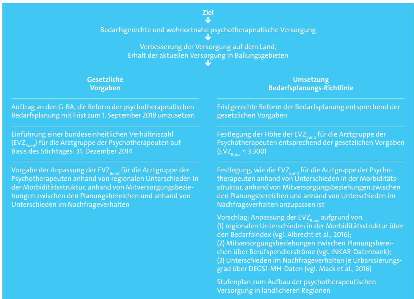
Abbildung 2: Notwendige gesetzliche Vorgaben für die Reform der psychotherapeutischen Bedarfsplanung zu Beginn der nächsten Legislaturperiode

Darüber hinaus sollte der Gesetzgeber vorgeben, dass eine Anpassung der bundeseinheitlichen Verhältniszahl anhand von regionalen Unterschieden in der Häufigkeit psychischer Erkrankungen, anhand von Mitversorgungsbeziehungen zwischen Planungsbereichen und anhand von Unterschieden im Nachfrageverhalten erfolgen soll (vgl. Abbildung 2).