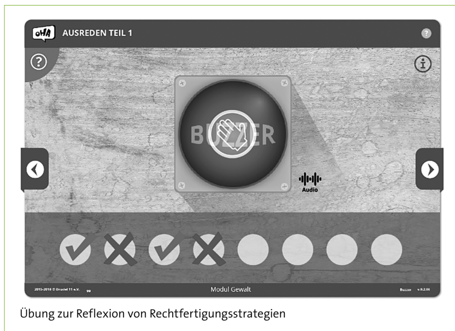
Übung zur Reflexion von Rechtfertigungsstrategien

schaftlichen, entwicklungsspezifischen oder persönlichen Herausforderungen anders umzugehen. Ausgehend von einer Ideologie der Ungleichwertigkeit als Kernelement des Rechtsextremismus (vgl. Heitmeyer et al. 1992, 13; Stöss 2005, 59), orientiert sich Deradikalisierung auf einer normativen Ebene an der grundsätzlichen Anerkennung der Gleichwertigkeit aller Menschen.