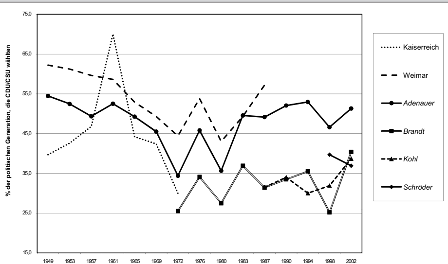
Abbildung 3: Wahlpräferenzen für die CDU/CSU politischer Generationen in Westdeutschland von 1949 bis 2002

Bei der Entstehung einer Parteipräferenz ist der politische Kontext des Jungwählers von großer Bedeutung. Zum einen spielen die Signale in seinem sozialen Milieu eine Rolle. Doch zusätzlich zu dieser sozialen Komponente ist der politische Kontext der ersten Wahlen wichtig. Parteien sind – über längere Zeit hinweg betrachtet – in manchen Jahrzehnten erfolgreicher als in anderen. Dieser Erfolg kann sich vor allem bei den Jungwählern einer bestimmten Wahl niederschlagen. 35 Demzufolge können sich Kohorten von Wählern voneinander unterscheiden. Die Erfolge einer Partei in einer bestimmten Periode können eine Kohorte stärker beeinflussen, die zu dem Zeitpunkt jung ist, als eine andere Kohorte, deren Mitglieder bereits mehr Wahlerfahrung haben und nicht mehr so beeinflussbar sind.