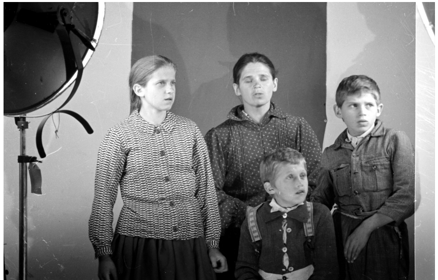
Abb. 7: Eine zum Fotografieren positionierte Mutter mit Kindern, von denen eines psychisch unterentwickelt war.

deutschen Anthropologen und Ethnografen schon im Jahr 1940 ein. Es wurden damals in Zakopane und in einigen umliegenden Dörfern stichprobenartig anthropologische Messungen an einer Gruppe Erwachsener und Kinder, darunter Schulkinder, vorgenommen. Erhalten geblieben sind Fragebögen, die man für 169 Personen, mitunter ganze Familien oder Gruppen gleichaltriger Kinder, angelegt hat. Zur gleichen Zeit wurden auch die Bestände des Hohe Tatra-Museums in Zakopane gesichtet, wobei 1 500 Ausstellungsstücke fotografiert wurden, die für die Volkskultur von Podhale und das ganze Karpatengebiet relevant sind. Ferner wurden 500 der dort gesammelten Fotografien kopiert, womit ein Grundstock für ein zukünftiges volkskundliches Archiv gelegt werden sollte, mit Quellenmaterial für spätere Forschungen.