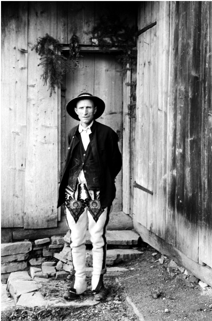
Abb. 10: Ein Foto aus der ethnografischen Sammlung: Ein Bewohner von Szaflary in Festkleidung.

Als sicher gilt, dass die Entscheidung über die Teilnahme an den Untersuchungen nicht dem Ermessen der Probanden überlassen war. Die deutsche Verwaltung forderte bei den Gemeindevorstehern vollständige Listen der Bewohner des jeweiligen Dorfes an, und verpflichtete sie, dafür zu sorgen, dass die Vorgeladenen an einem bestimmten Tag auch wirklich zur Untersuchung erschienen. Die Messungen und die ärztliche Untersuchung fanden gewöhnlich in der Ortsschule oder im Pfarrhaus statt. Jegliche Nichtbeachtung dieser Anordnungen wurde