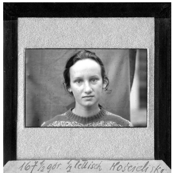
Abb. 8: Eines der bunten Dias, auf denen ausgewählte Einwohner von Podhale zu sehen sind.

ry ein Ort war, an dem sich im Mittelalter tatsächlich deutsche Siedler niedergelassen hatten. Vom Umfang dieser Erhebung zeugt die Tatsache, dass 1 003 Dorfbewohner (praktisch alle Szaflarer) – von 2-jährigen Kindern bis zu 90-jährigen Greisen – genaue anthropologische und medizinische Untersuchungen über sich ergehen lassen mussten. Allen wurden Fingerabdrücke abgenommen. Erhalten blieben auch einige hundert Karteikarten mit Handabdrücken und etwa genau so viele Umschläge