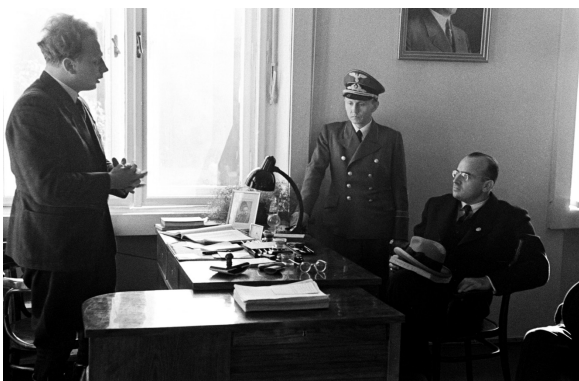
Abb. 1: Hans Frank besucht das Institut für Deutsche Ostarbeit am 23. September 1940.

Das Institut stellte seine Aktivitäten um die Mitte