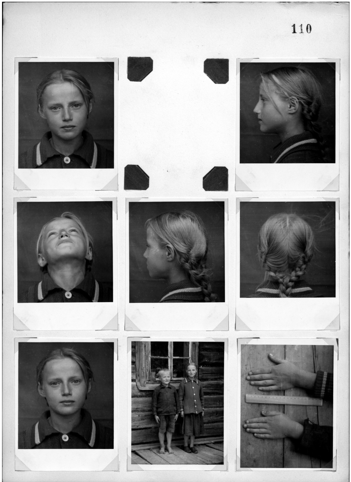
Abb. 2 + 3: Fragebogen mit anthropozentrischen Angaben und beigelegten Aufnahmen der untersuchten Person.