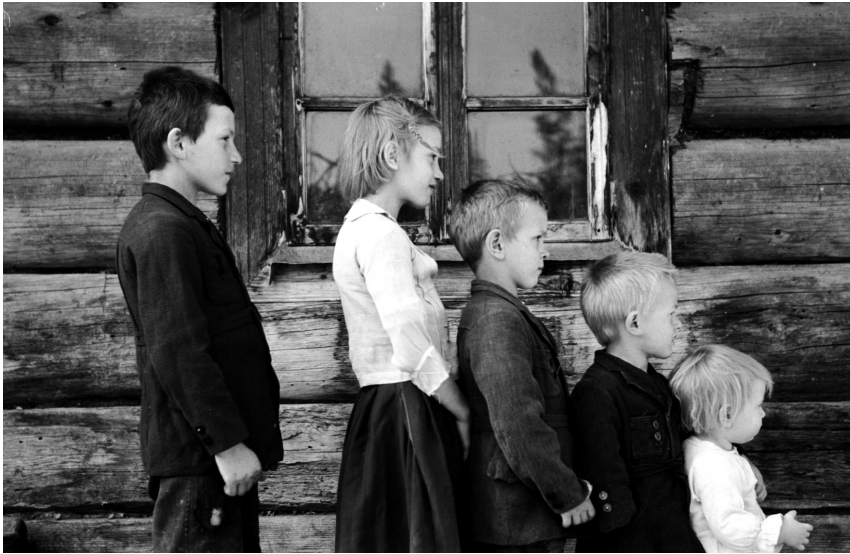
Abb. 6: Anthropologisches Foto, aufgenommen vor dem Haus der untersuchten Personen.