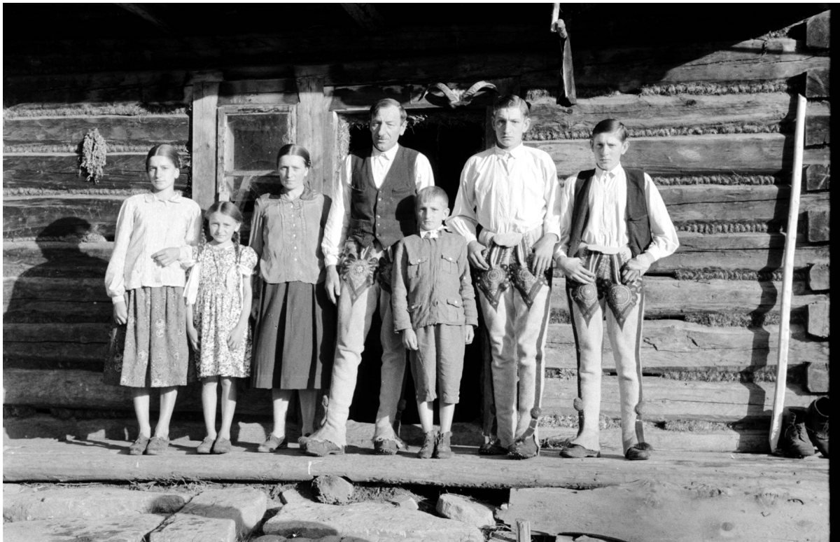
Abb. 9: Eine Familie, deren sämtliche Angehörigen einer anthropologischen Untersuchung unterzogen wurden.

mit Haarproben. In den Archiven fanden sich auch 630 Fotos – als Ergänzung zu den Fragebögen, die man zur Ermittlung der Rassenzugehörigkeit verwendet hatte. In 238 Fragebögen, die über das soziale Umfeld Auskunft geben sollten, wurden über alle Angehörigen der jeweiligen Familie folgende Daten genau erfasst: Bildungsgrad, Beruf, Verhältnis zu verschiedenen Gemeinschaften, wie Familie, Kirche und Vereine und Mobilität. Zur wirtschaftlichen Lage ermittelte man u. a. Struktur und Größe der bewirtschafteten Fläche, Anbauarten, landwirtschaftliche Geräte, Grundnahrungsmittel. Über die Männer wissen wir u. a. auch, ob, wann und wo sie den Militärdienst abgeleistet und wie oft sie zu welchen Zwecken das Dorf verlassen haben.