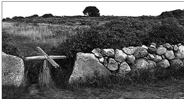
Abb. 1: Ein Drehkreuz in den Rinderweiden auf Block Island, Rhode Island.

Die These, dass diese Formen der Steuerung verdichteter menschlicher Körper durch einen Wissens- und Techniktransfer aus dem Feld der sogenannten „Tierproduktion“ und Viehhaltung ermöglicht wurde, lässt sich noch weiter erhärten. So verweist auch die Perey Company, der erste und bis heute weltweit führende Hersteller und Patentinhaber von Vereinzelungsanlagen, auf die