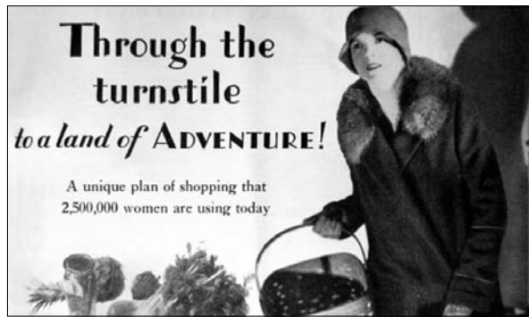
Abb. 3: Detail einer Werbeanzeige für die neuen Piggly-Wiggly-Märkte aus dem Jahre 1929. Quelle: The Delineator, Januar 1929, S. 18. https://rememberedsummers.wordpress.com/tag/piggly-wiggly-ad-1929/ [Stand: 30.10.2015]

als nichts weniger denn Epochenschwellen zu einem neuen Zeitalter der Prosperität und Emanzipation propagiert.