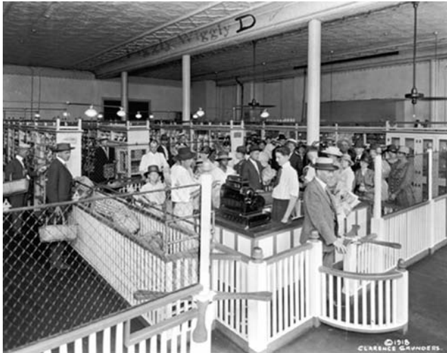
Abb. 2: Fotografie des ersten Piggly Wiggly Store, Memphis, Tennessee von Clarence Saunders aus dem Jahre 1918.

reichten, das direkt an der Kasse installiert war. Dort kassierte sie der einzige Angestellte des Geschäfts ab (Abb. 2).