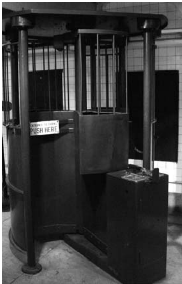
Abb. 5: Die Iron Maiden bzw. High Entrance/Exit Turnstile (HEET), ca. 1934. Ausgestellt im New York Transit Museum

Gerade hinsichtlich der Verfügbarkeit der Münzen zeigte sich in den Monaten nach der Installation der Drehkreuze ein überraschendes Phänomen: Nahezu alle Passagiere der Subway hatten rasch die Gewohnheit angenommen, ihr Fahrgeld passend parat zu halten. So wurde der Durchgang durch die Schleusen beschleunigt und die Überfüllung der Eingangsbereiche erheblich reduziert. Diese erfolgreiche Disziplinierung scheint dabei für die Betreiber so eindrücklich gewesen zu sein, dass man nicht müde wurde, in Anzeigen und Pressemitteilungen immer wieder darauf hinzuweisen. 31 Auch hier begegnet uns das Moment der Auslagerung von Arbeit an die Kunden wieder, dass bereits in Saunders Supermärkten mobilisiert wurde. Ihr Erfolg bei den Passagieren mag der Faszination für den Automatismus dieser Apparaturen ebenso geschuldet sein wie den massenhaften Aushängen, mit denen die Menschen mit dieser neuen Technologie vertraut gemacht werden sollten (vgl. Abb. 4).