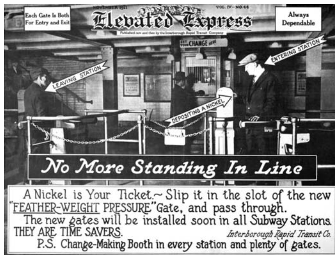
Abb. 4: Aushang vom November 1921, der den Passagieren der Subway den richtigen Umgang mit den Drehkreuzen beibringen sollte.

diese Technologie als nicht unproblematisch heraus. Gerade bei den frühen Modellen führten Abweichungen von den inskribierten idealen Passagierkörpern immer wieder zu Störungen: „it invited considerable congestion when fat passengers sought to make the passage.“ 28 Dass die Betreiber dennoch an der kräftezehrenden Weiterentwicklung der Apparate festhielten, wird vor dem Hintergrund der damaligen ökonomischen Situation der Subway verständlich. Eine massive Inflation infolge des Ersten Weltkriegs sowie die vertragliche Festschreibung des Fahrpreises auf fünf Cent brachte die Subwaybetreiber an den Rand des Ruins. 29 Doch auch hier versprachen die Verfahren rational-logistischer Effizienzsteigerung Abhilfe. Neben den Optimierungen der Betriebsabläufe unter den Imperativen der Standardisierung und Kostenersparnis stand vor allem die Automatisierung einzelner kritischer Elemente des Systems im Zentrum dieser Bestrebungen. Wie auch bei Saunders Selbstbedienungsmärkten erlaubte dies nicht zuletzt die Reduktion von Arbeitskräften. Die im Jahre 1921 erfolgte Umstellung auf automatisierte Systeme zur Kassierung des Fahrpreises und Einlasskontrolle resultierte in Hunderten von Entlassungen. So benötigte man statt vormals vier Angestellten pro Eingang nun nur noch zwei: eine Aufsicht für die Drehkreuze und eine Person für die neu installierten Wechselkabinen, die den Passagieren gegebenenfalls ihr Fahrgeld in Nickel wechselte. 30