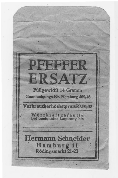
Abb. 8: Tütchen für Pfefferersatz aus dem Jahr 1946.

Die Herstellung des Kunstzimts konnte ihrerseits leicht mit der von Kunstnelken gekoppelt werden, denn das zur Fabrikation des künstlichen Zimtöls erforderliche Eugenol war nichts anderes als der Hauptaromastoff der Gewürznelken. Man brauchte nur etwa 8 Gewichtsprozent Eugenol auf etwa 82 Gewichtsprozent gemahlene extrahierte Nelkenstiele, Haselnuss- oder Kakao-schalen aufzutragen und zu vermischen, um ein Produkt zu erhalten, das als Kunstnelken vermarktet werden konnte. 105 Der Hamburger Chemiker Schmalfuß hatte während des „Dritten Reichs“ noch mit einem anderen Aromastoff Erfolg. Seinen Forschungen war es zu verdanken, dass Diacetyl (2,3-Butandion) im Jahr 1929 als Aromaträger der Butter erkannt wurde und Anfang der 1930er