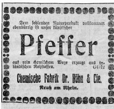
Abb. 4: Werbung für Kunstpfeffer der Chemischen Fabrik Dr. Höhn & Cie. in Neuss, Frankfurter Zeitung vom 6.2.1917.

Staudinger und Immerwahr ließen ihre Synthese bei der Rheinischen Kampfer-Fabrik in Düsseldorf-Oberkassel im industriellen Maßstab realisieren (Abb. 3). 47 Diese stellte eines der drei möglichen Piperidide her, wobei die Verfügbarkeit der jeweiligen Rohstoffe bestimmte, welche Verbindung nun genau produziert wurde. Die Chemische Fabrik Dr. Höhn & Cie. in Neuss am Rhein verarbeitete das jeweils hergestellte Piperidid dann durch Aufbringung auf ein Matrixmaterial zu Kunstpfeffer weiter (Abb. 4). 48 Zu