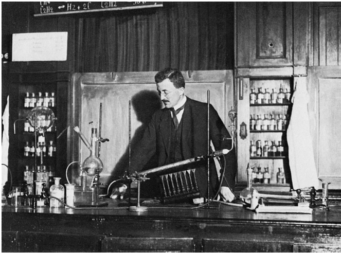
Abb. 2: Hermann Staudinger in der Vorlesung in Zürich, um 1912.