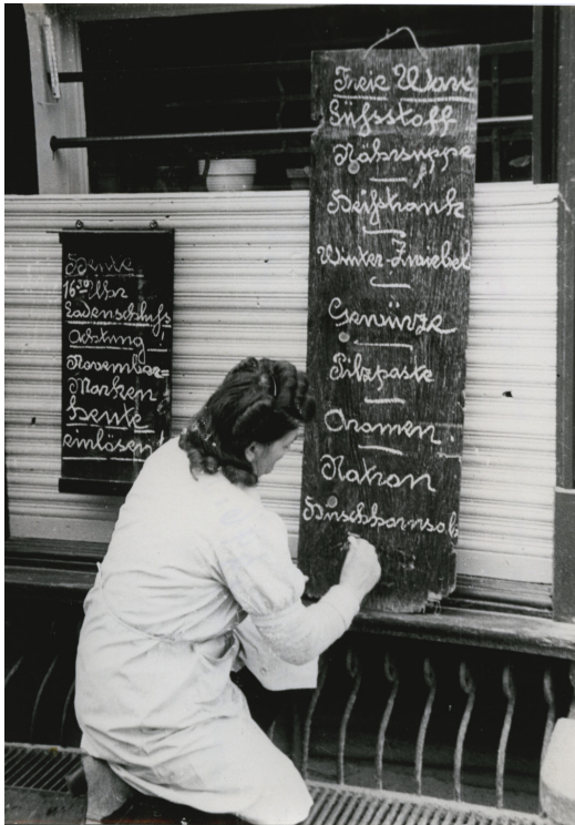
Abb. 9: Angebot eines Berliner Lebensmittelgeschäfts, November 1946. Zu den Waren, die ohne Lebensmittelmarken erhältlich waren, gehörten Gewürze und Aromen.

spürbar blieben. Auf technologischer Ebene, also in der Praxis der Gewürzfabrikation, lassen sich sogar bis in die Gegenwart reichende Kontinuitäten festmachen.