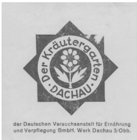
Abb. 5: Logo des Kräutergartens im KZ Dachau.

Wer kein eigenes Kräuterbeet besaß, erhielt Hinweise, was er beim Sammeln und Trocknen wild wachsender Gewürzkräuter beachten müsse, um einwandfreie Ware zu erhalten. 70 Seit 1936 wurden überdies die Anbauflächen für deutsche Heil- und Gewürzpflanzen vergrößert, was schnell zu Produktionssteigerungen bei Gewürzkräutern wie Majoran, Senf, Fenchel, Kümmel, Salbei, Thymian, Koriander, Dill, Bohnenkraut und Estragon führte. 71 Um die kostenlose Arbeitskraft der KZ-Häftlinge auszubeuten, wurden sogar in Konzentrationslagern Gewürz- und Heilkräuterplantagen angelegt. Die bekannteste und am besten erforschte Anlage befand sich im KZ Dachau (Abb. 5). 72 Bei der Abteilung „Heilkräutergarten“ der 1939 gegründeten, SS-eigenen „Deutschen Versuchsanstalt für Ernährung und Verpflegung“ in Dachau