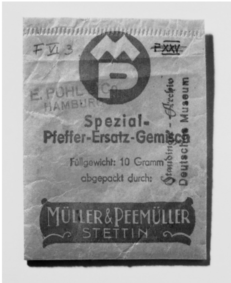
Abb. 6: Tütchen mit Pfeffer-Ersatz-Gewürz aus dem Jahr 1944 aus dem Nachlass Hermann Staudingers.

fügung gestellt hatte. 88 E. Pohl & Co. produzierte während des Zweiten Weltkriegs nicht nur Kunstpfeffer (Abb. 6), sondern auch noch andere Kunstgewürze, wie Kunstzimt, Kunstpiment, Kunstcardamom 89 und Kunstmacis (also Kunstmuskatnuss). 90 Auf einer vom 13. August 1942 datierenden Liste, auf der insgesamt 49 Gewürzfabrikanten aufgeführt waren, die eine Genehmigung zur Herstellung von Ersatzgewürzen erhalten hatten, wurden zehn Hersteller von Kunstgewürzen, darunter auch Kunstpfeffer, genannt. 91 Im Umkehrschluss bedeutete dies, dass 1942 nur etwa 20% der autorisierten Hersteller von Gewürzersatz dazu synthetische Aroma- und Geschmacksstoffe verwendeten. 80% der Fabrikanten stellte Gewürzersatz aus „deutschen Kräutern“ ohne Verwendung synthetischer Geschmacks- oder Aromastoffe her. Ihr Ersatzpfeffer bestand aus variabel zusammengesetzten Mischungen scharf schmeckender heimischer Kräuter, die als „deutscher Pfeffer“ oder „deutsches Pfeffergewürz“ vermarktet wurden. Wegen des hohen Anteils an Bohnenkraut dürften die „deutschen Kräutermischungen“ zwar scharf, wegen des Fehlens der Inhaltsstoffe des etherischen Pfefferöls aber nicht nach Pfeffer geschmeckt haben. Die Frage, inwiefern Staudingers