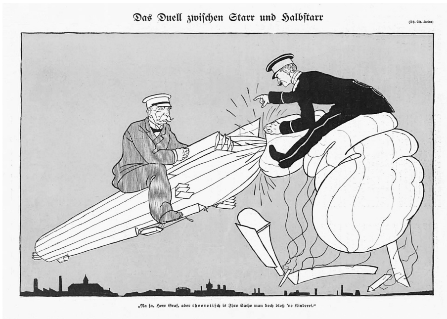
Abb. 1: Technische Kontroversen in der satisfaktionsfähigen Gesellschaft.

halbstarre Luftschiff ist, anscheinend weil ihm die innere Festigkeit des Konkurrenzmodells fehlt, zu einer halbschlaffen Wurst reduziert, und dem Major Groß bleibt nur, in der Bildunterschrift die ungehörige Empirie gegen die immer noch auf seiner Seite stehende Theorie zu schelten: „Na ja, Herr Graf, aber theoretisch ist Ihre Sache man doch bloß ‘ne Kinderei.“ Immerhin behält der Verlierer des Duells damit das letzte Wort.