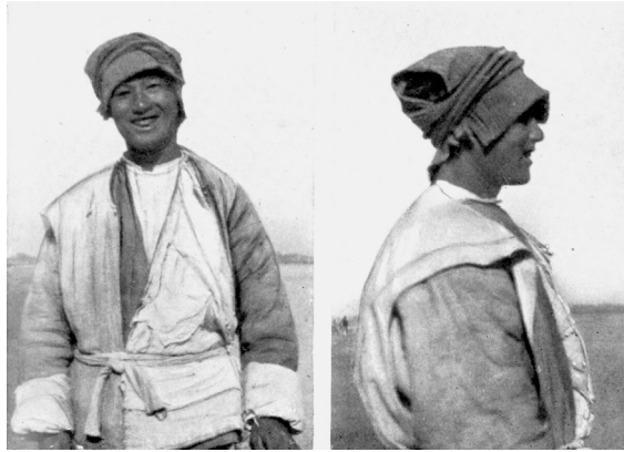
Abb. 2: Ein Schiebkarrenmann.

gewesen sein. Die Karrenleute hingegen waren zunehmend zur Selbstaussbeutung gezwungen, insbesondere in Mangel- und Notzeiten, wenn mehr Männer um weniger Verdienstmöglichkeiten miteinander konkurrierten. 17