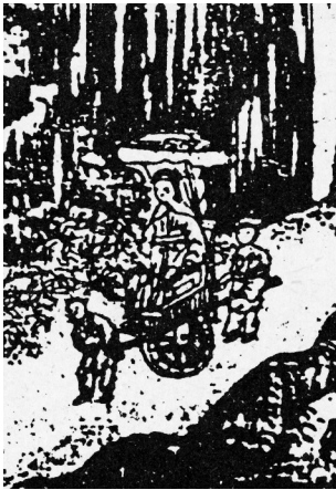
Abb. 3: Detail aus dem Bild Jiangyu gumei tu (Alte Prunusbäume auf der Changjiang-Insel). Quelle: ZHANG Wanxuan (Hg.), Xiao Yuncong (ill.), Taiping shanshui tuhua (Illustrierte Beschreibung der Landschaft Taipings), Orig. 1648, Reprint in: Zhongguo gudai banhua congkan (Alte chinesische Drucke), II-8, Shanghai 1994, S. 64.

besonders interessant, nicht nur weil es einen durchaus eleganten Touristen in einer eleganten Publikation und in einer der reichsten Regionen zeigt, sondern weil der Passagier nicht auf den bankartigen Auflagen, sondern auf dem Radkasten sitzt. Da mir bisher keine andere Quelle der späten Kaiserzeit bekannt ist, aus der sich diese Art der Passagierkarre bestätigen ließe, konnte nicht geklärt werden, ob dies die „bessere“ Reiseschiebkarre war, die sich hinter Bezeichnungen wie gongji che oder xiaogan che verbergen könn-