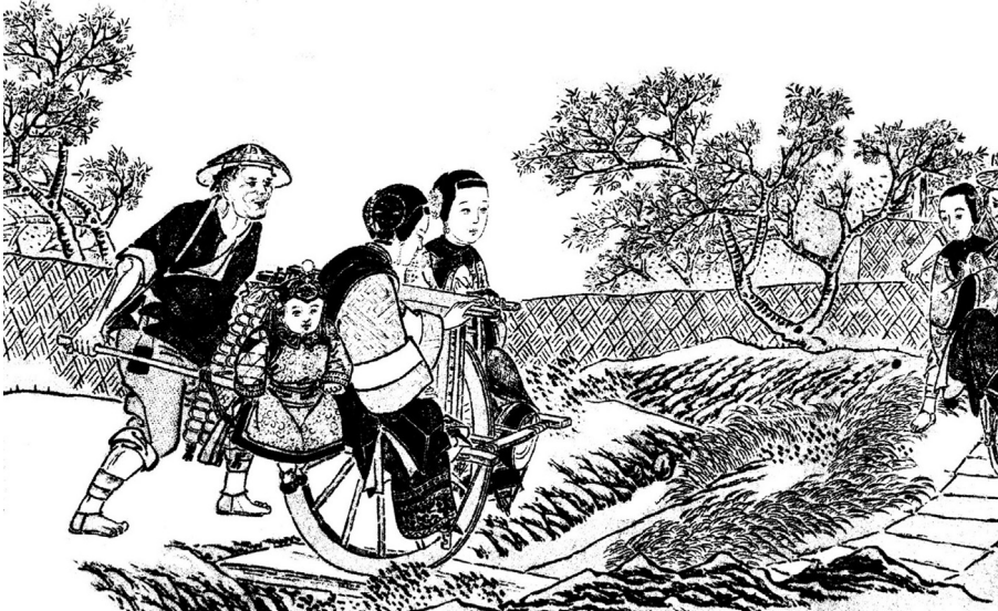
Abb. 4: Zwei Frauen und ein Kleinkind in festlicher Ausstattung unterwegs zu einem Tempel bei Shanghai. Photolithographie nach einer Tuschezeichnung von Wu Youru, vermutlich 1880er Jahre.

besonders interessant, nicht nur weil es einen durchaus eleganten Touristen in einer eleganten Publikation und in einer der reichsten Regionen zeigt, sondern weil der Passagier nicht auf den bankartigen Auflagen, sondern auf dem Radkasten sitzt. Da mir bisher keine andere Quelle der späten Kaiserzeit bekannt ist, aus der sich diese Art der Passagierkarre bestätigen ließe, konnte nicht geklärt werden, ob dies die „bessere“ Reiseschiebkarre war, die sich hinter Bezeichnungen wie gongji che oder xiaogan che verbergen könn-