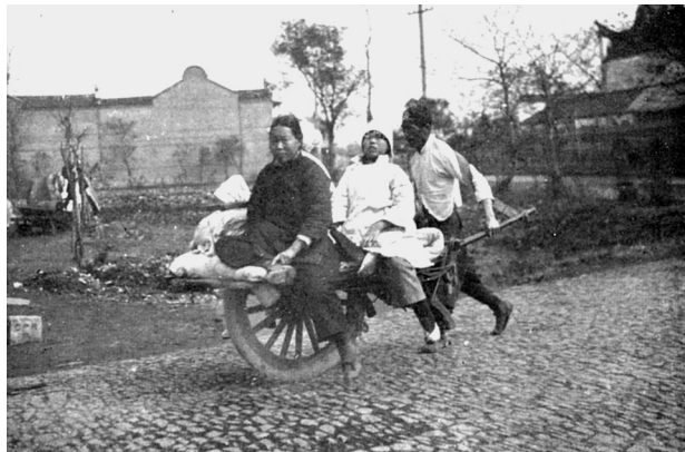
Abb. 5: Zwei Frauen auf einem Schiebkarren am Rand von Shanghai.

Beobachtungen und Fotos, zumeist von Reisenden aus dem Westen, bestätigen, dass Frauen in vielen Städten und Stadtrandgebieten der Nordchinesischen Tiefebene Schiebkarren benutzten. 26 Chinesische Quellen, die