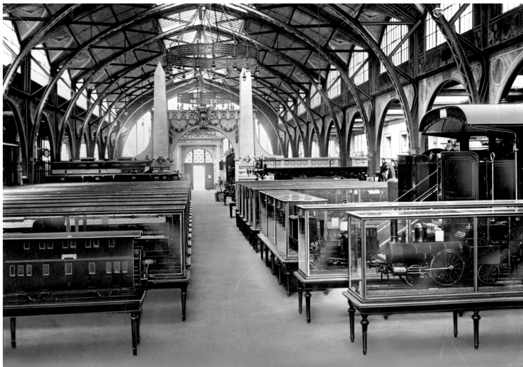
Abb. 1: Der zentrale Saal mit der Eisenbahnsammlung im neu eröffneten Verkehrs- und Baumuseum (1906).

Entscheidendes bleibt in dieser Chronik der Ereignisse ausgeblendet. Wodurch wurde der Halbschlaf des Museumsgedankens beendet? Hinweise dazu finden sich weder in der unmittelbaren Aktenüberlieferung zum Verkehrs- und Baumuseum, noch in den späteren Darstellungen zum Verkehrs- und Baumuseum. Dennoch „kam“ es nicht ohne Grund „zur Einrichtung eines Bau-