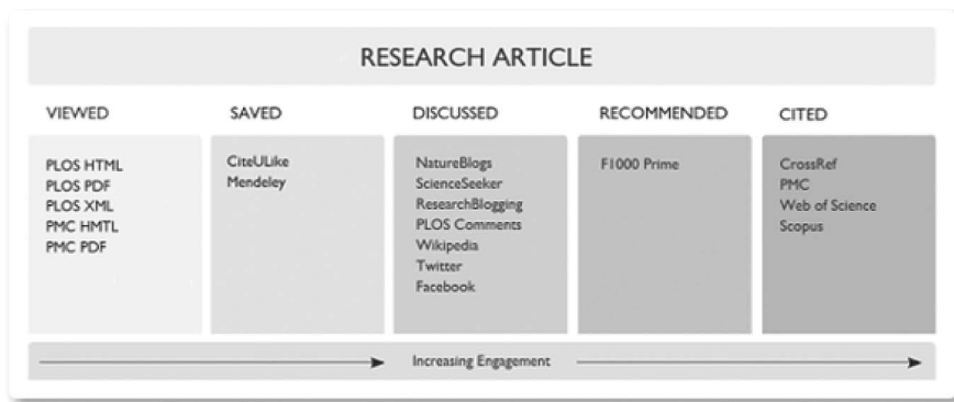
Abbildung 1: Klassifikation der PLOS ALMs

Die sogenannten ALMs der Public Library of Science, die für jeden einzelnen Artikel ausgewiesen werden, umfassen die folgenden Kategorien: Viewed, Saved, Discussed, Recommended und Cited (Abb. 1). Diese Klassifikation soll zugleich den steigenden Aktivitätsgrad des Rezipienten wiedergeben: Das Verhältnis von Downloads auf der einen Seite des Spektrums zu Zitierungen in der wissenschaftlichen Literatur auf der anderen Seite beträgt etwa 70:1 (Lin / Fenner 2013: 23). Aus Abbildung 1 gehen die aktuell verwendeten Datenquellen hervor, die im Falle der „Saved“-Kategorie Online-Literaturverwaltungsprogramme wie Mendeley einschließen oder im Falle der „Discussed“-Kategorie die Sozialen Medien wie Wikipedia, Twitter und Facebook.