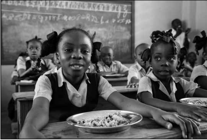
Pfarrschule St. Francois de Sales, Cap Haitien.

wir auch mit unseren Dienstleistern, den von uns beauftragten Journalisten, eine Übereinkunft bezüglich eines Ethik-Kodex, der für alle gilt, die für die Öffentlichkeitsarbeit von „Adveniat“ arbeiten. Fotografen, die für uns unterwegs sind, werden von uns ausführlich gebrieft.