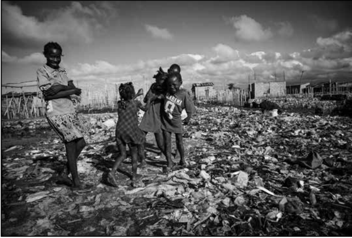
Kinder im Stadtteil Petite Anse in Cap Haitien in Haiti. Petite Anse ist ein entstehendes Armenviertel. Es wächst in die Mangrovenwälder, nasse, sumpfige Stellen werden mit Müll trockengelegt.

über eine andere Bildsprache ein größeres Publikum erreichen würde. Im Gegenteil: Wir setzen uns damit auch bewusst ab von der symbolischen Bildsprache der Gewalttäter, die ja ihre Morde inszenieren. Ich glaube, dass Lateinamerika es grundsätzlich im Augenblick sehr schwer hat, öffentlich beachtet zu werden, weil sich der Blick der Öffentlichkeit auf ganz andere Krisen richtet. Die spielen sich ab in Afrika mit Ebola und in der Ukraine und in Russland, in diesem Konflikt, der einfach sehr viel näher an Europa ist. Lateinamerika gerät da einfach ein bisschen in Vergessenheit. Da gibt es Konflikte und Krisen, die schon so lange dauern, dass es nichts Neues mehr zu berichten gibt. Jetzt gibt es zum Beispiel den Friedensprozess in Kolumbien nach einem bald 60-jährigen Konflikt, der sich auch nahezu unsichtbar abspielt. Suchen sie einmal im Internet nach Bildern von der FARC – die finden sie gar nicht. Das ist ein Konflikt, den man nicht bebildern kann.