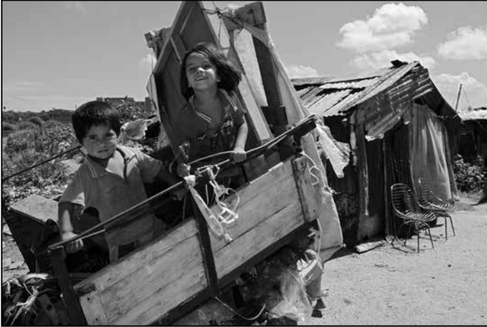
Kinder in Unidos.