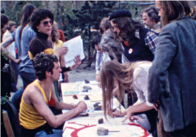
Pfingstaktion und erste Schwulendemonstration Westberlin, 1973