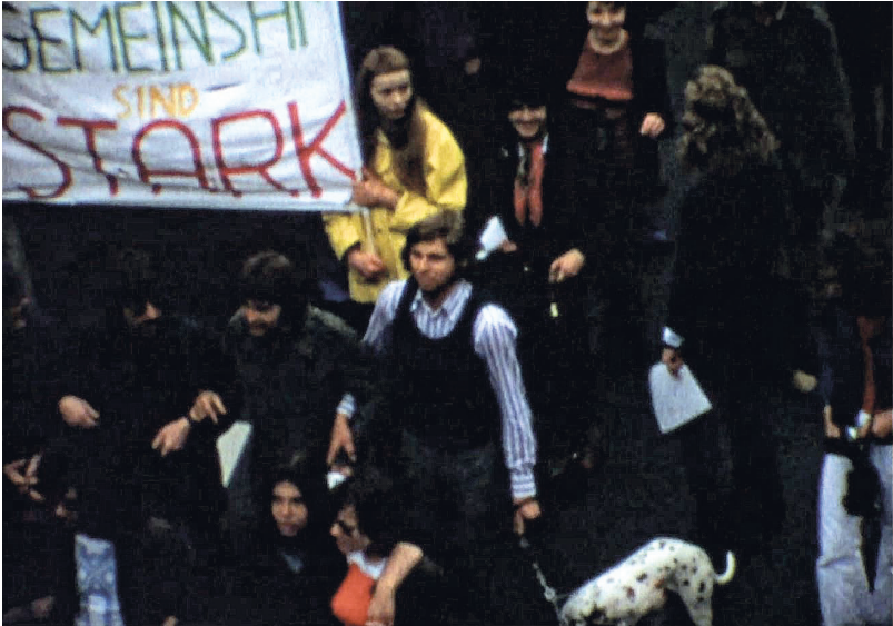
Erster Christopher Street Day Westberlin, 1979