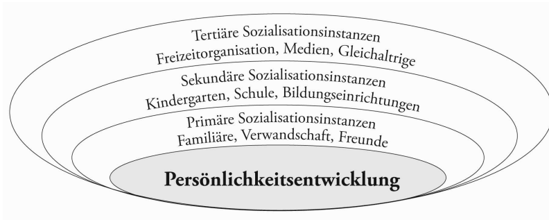
Abb. 3: Die Struktur sozialisationsrelevanter Organisationen und Systeme – Hurrelmann (2006), S. 34

eine innere Konzeption der Gesamtheit der Einstellungen, Bewertungen und Einschätzungen, die ein Mensch im Blick auf die eigenen Handlungsmöglichkeiten in der äußeren Realität besitzt. Voraussetzung hierfür ist eine realistische, sensible Wahrnehmung der Grundbedingungen der inneren Realität [...]. [...] Von Identität kann gesprochen werden, wenn ein Mensch über verschiedene Entwicklungs- und Lebensphasen hinweg eine Kontinuität des Selbsterlebens auf der Grundlage des positiv gefärbten Selbstbildes wahr. [...] Störungen der Identitätsbildung haben ihren Ausgangspunkt in einer mangelnden Übereinstimmung zwischen den personalen und sozialen Komponenten der Identität, also den Bedürfnissen, Motiven und Interessen auf der einen und den gesellschaftlichen Erwartungen auf der anderen Seite« (ebd., S. 38f.).