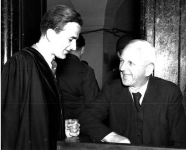
Richard und Ernst von Weizsäcker im Gerichtssaal 1948/49. 2