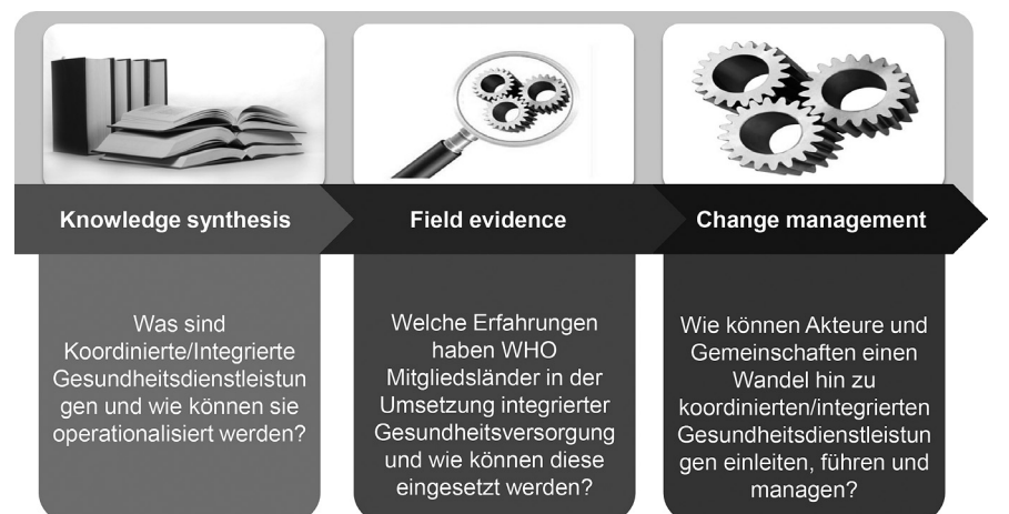
Abbildung 2. Die drei Säulen des Aktionsrahmens für Koordinierte/Integrierte Versorgung

Quelle: WHO Regionalbüro für Europa 2014, unveröffentlicht.