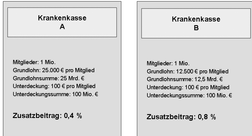
Abbildung 1: Wirkungen der Grundlohnsumme auf die Höhe des Zusatzbeitrages

solter Geldbetrag geschöpft werden muss, ist es nun mal entscheidend, wie hoch die Grundlohnsumme ist.